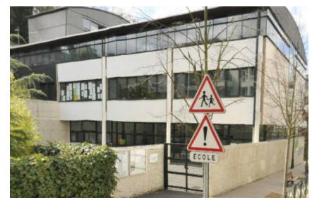
École Perrault - Brossolette