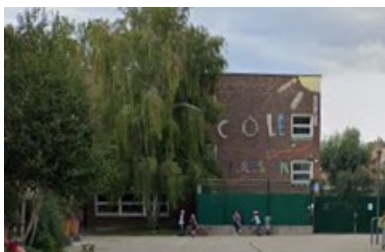
École Ferdinand Buisson