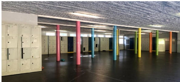
Le préau, avec les casiers

Pour conclure, la vie de 6ème est très bien à Bel Air !!